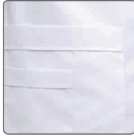
doppelte aufgesetzte Seitentaschen